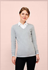
SOL'S GLORY WOMEN 01711