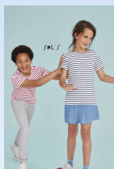
MILES KIDS 01400