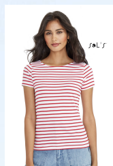
MILES WOMEN 01399