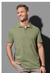
ST9060 Harper Polo