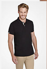
SOL'S PORTLAND MEN 00574