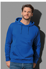
ST4100 Sweat Hoodie Classic