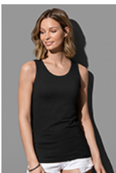
ST2900 Classic Tank Top