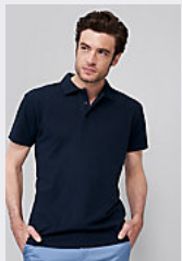
SOL'S SUMMER II 11342