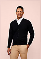
SOL'S GOLDEN MEN 90011