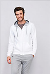
SOL'S SOUL MEN 46900