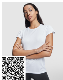
IMOLA WOMAN CA0428