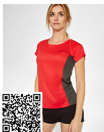
SHANGHAI WOMAN CA6648