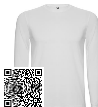
SOUL L/S R12510