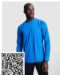
MONTECARLO L/S CA0415