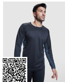
SHANGHAI L/S CA6670