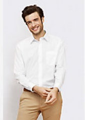
SOL'S BALTIMORE 16040