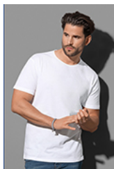
ST9100 Finest Cotton-T